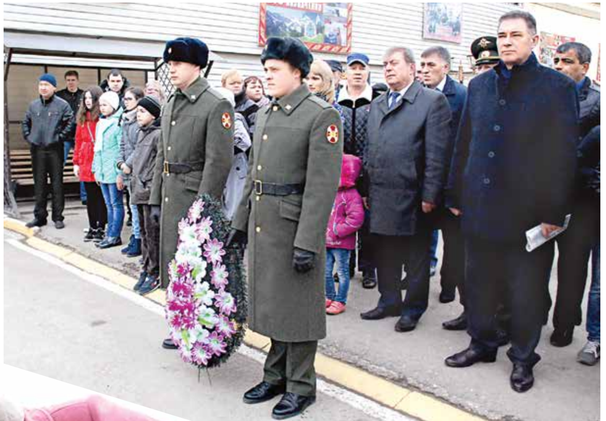
После минуты молчания к памятнику павшим военнослужащим были возложены венки и цветы. Затем участники памятного мероприятия посетили городское кладбище, почтив память погибших.