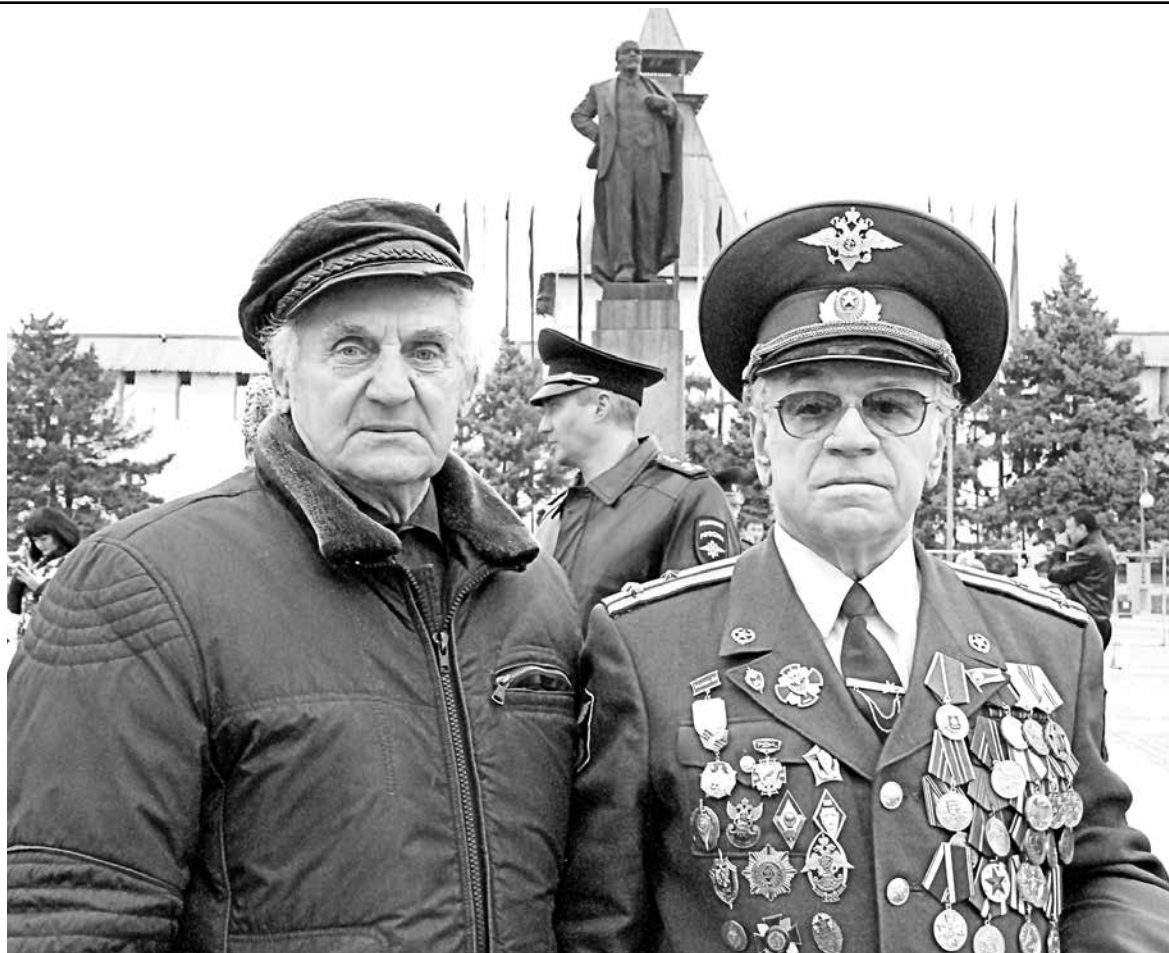
Ветераны на параде в честь Дня сотрудника МВД России.

О. П. АГАРКОВ, начальник УМВД России по Астраханской области, генерал-майор полиции Астраханской области