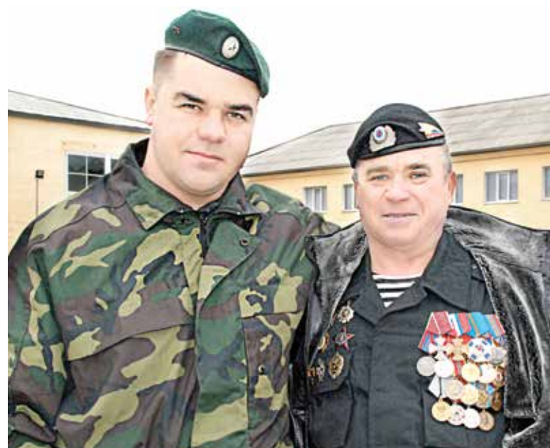
Участники боевых действий и сегодня в строю.