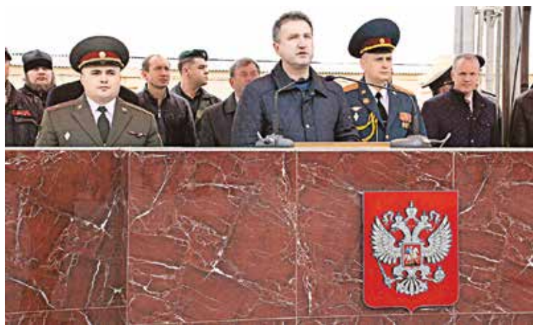
Общественные деятели поблагодарили военнослужащих за самоотверженность при выполнении воинского долга.