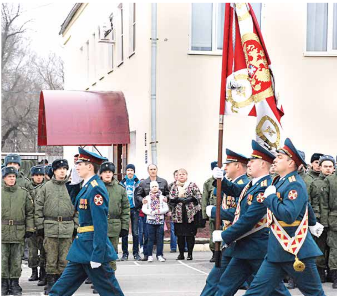
За мужество и героизм, проявленные при проведении контртеррористической операции, более 400 военнослужащих части награждено государственными и ведомственными наградами.